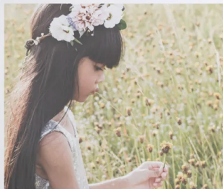
Mi Primera Comunión